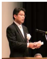
式辞を述べる西岡市長