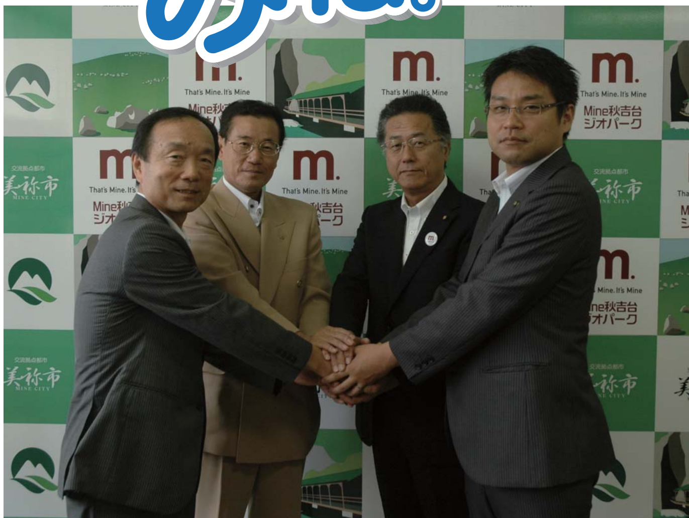
写真左から、塩谷代表取締役社長、藤村県商工労働部企業立地統括監、荒山市議会議長、西岡市長