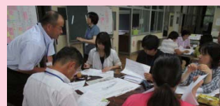
於福小・中合同研修会

子どもたちの幸せを願う教職員の話し合いは、とても熱心で有意義なものとなりました。2学期以降の各学校での取り組みにますます磨きがかかります。