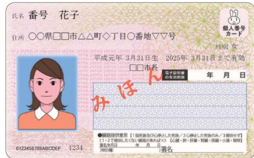
マイナンバーカード（個人番号カード）

問合せ先 市民課 [☎0837(52)5230] 美東総合支所総合窓口課 [☎08396(2)5009] 秋芳総合支所総合窓口課 [☎0837(62)1910]