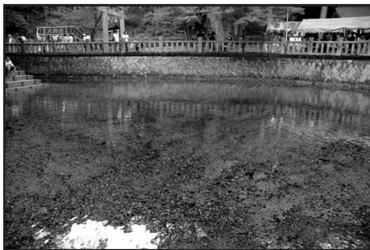
別 府 弁 天 池

透き通ったブルーの水が不思議なほどの美しさを見せるカルスト地形特有の湧き水「別府弁天池」。 この湧き水は摂氏14度の透明度の高い水で、環境庁より昭和60年7月20日、日本名水百選に選定され、灌漑や養鱒にも利用されている。 また、ここは別府厳島神社の境内でもあり、その昔、辺りを開墾したものの水不足に悩む長者が、夢のお告げ通りに弁財天を勧請すると水が湧き出したという伝説を持つ。毎年秋にはこの神与の水に感謝の気持ちを込め、念仏踊りが奉納されている。