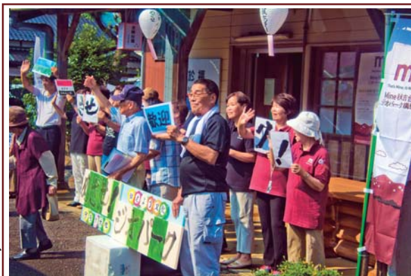
於福駅でのお出迎えの様子