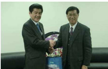
更なる友好交流の進展を誓う 村田市長と林県長（右）

また、村田市長が村岡山口県知事から託された、当選を祝すメッセージを林県長に手渡しし、「南投県と山口県の友好交流が、今後美祢市と同様に深まることを希望する。」と述べました。