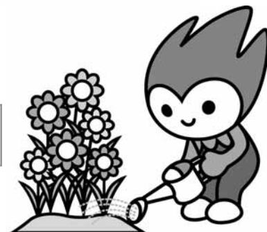
山口国体イメージキャラクター ちよるる