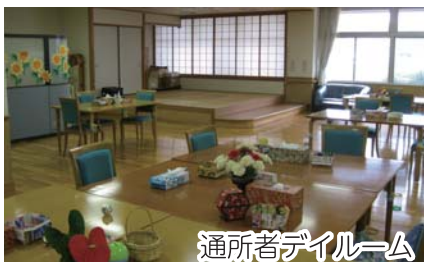
通所者ダイニング