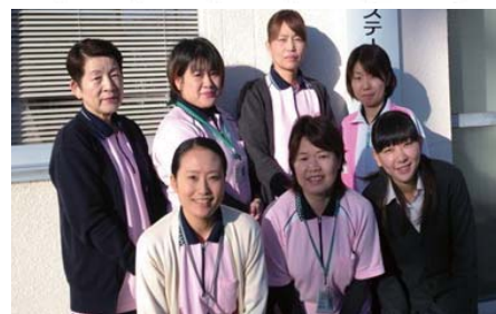
美祢市訪問看護ステーション職員

現在、高齢化が進む中で病院や施設の利用、介護を必要とする人が増えています。少しでも多くの地域のみなさんが住み慣れたご自宅で安心して過ごせるために私たちは病院や施設、ケアマネージャー、ヘルパー、訪問入浴など様々な機関と協力をして今後も在宅の生活をお手伝いしていきます。ご利用をお待ちしています。