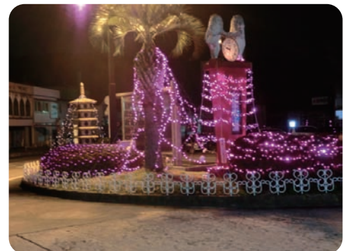
桜をイメージしたイルミネーション