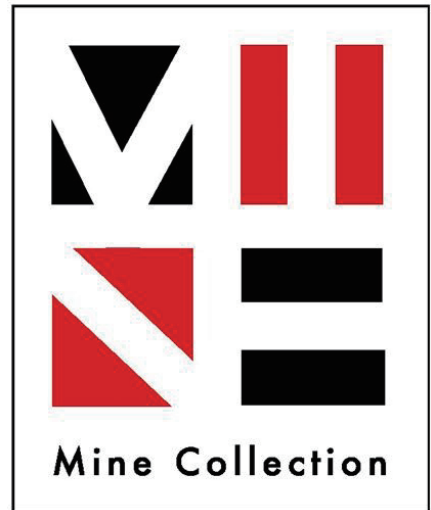
美祢ブランド認定商品

市では、当市が誇る地域資源をもとに開発された商品をブランドとして認定し、知名度やイメージの向上、高付加価値化そして地域の活性化を図っていきます。新しい地域ブランドの名前は『Mine Collection』通称ミネコレ。