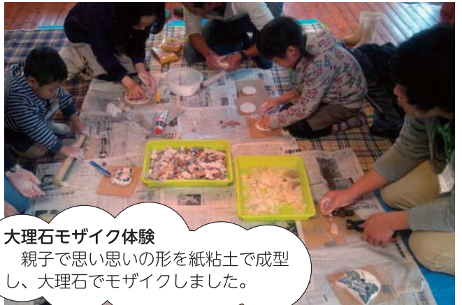
大理石モザイク体験 親子で思い思いの形を紙粘土で成型し、大理石でモザイクしました。

このコミュニティ助成事業は、市民の皆さんの各種行事やイベントに広範囲に利用でき、自主的な活動の推進を図り、魅力あるふるさとづくりを推進するために、「自治宝くじ」の助成を受けて実施するものです。