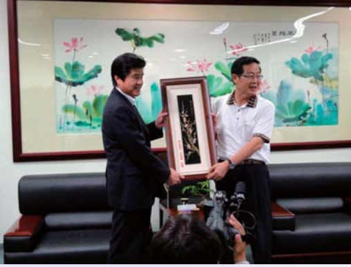
李縣長から記念品の贈呈