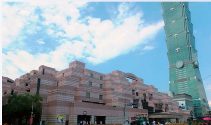
台北世界貿易センター

将来的には、本市の観光振興だけでなく、経済・産業面での交流促進へ期待が寄せられています。