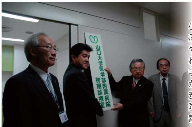
初期診療室の入口に看板を設置

さらに、今後、医師（助教）3名は美祿市立病院で、山口大学の医学生や研修医に対し、地域医療や初期診療の指導も行う予定となっています。