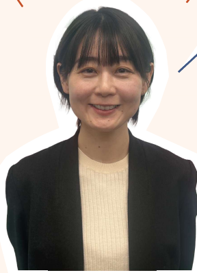
name 山中 法子 studio remine 建築士事務所