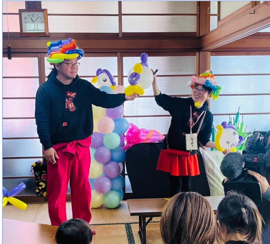
子育て広場 バルーン教室