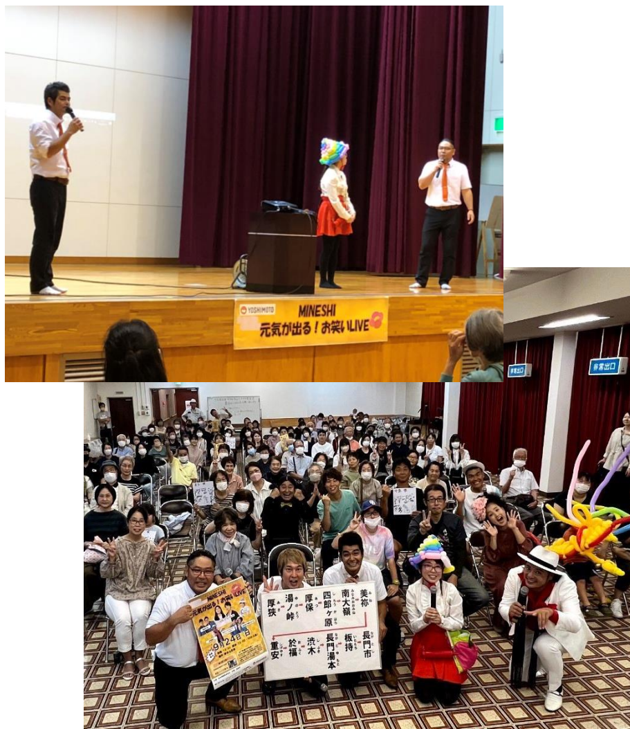
吉本興業主催 災害復興支援LIVE