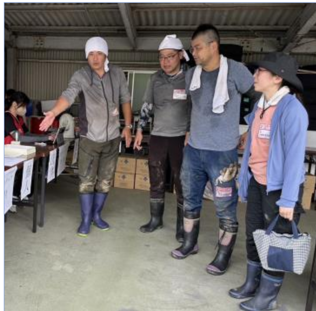
災害ボランティア活動に参加