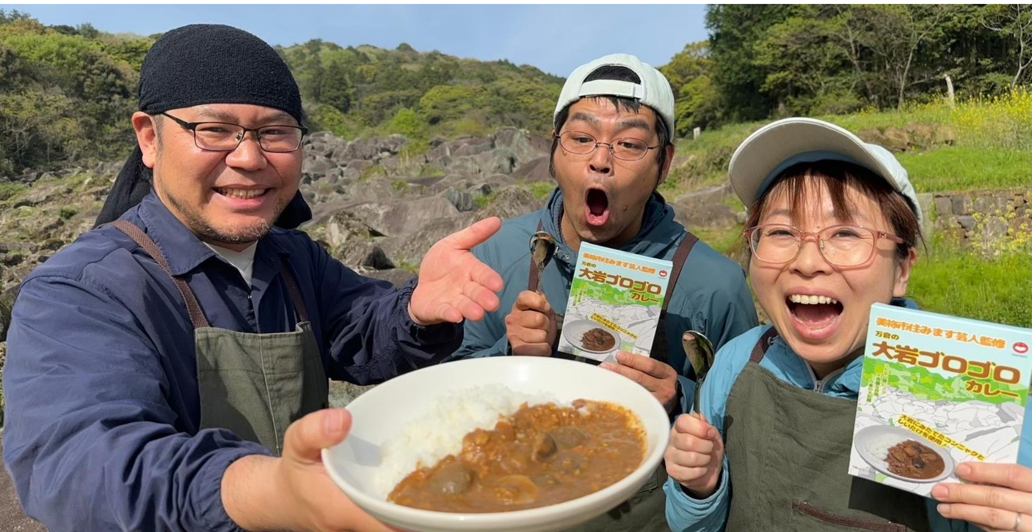
美祢市住みます芸人プロデュース “万倉の大岩ゴロゴロカレー” 販売