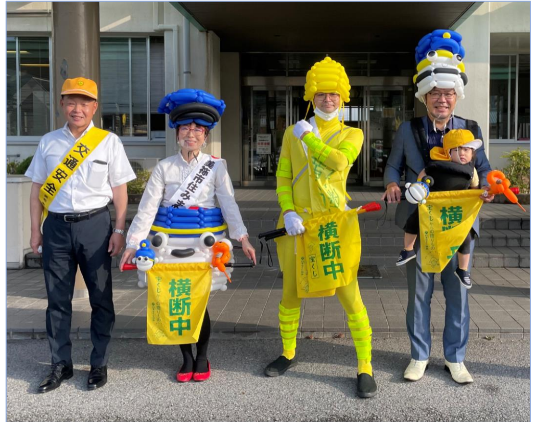
交通安全キャンペーン