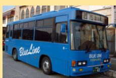
ブルーライン交通