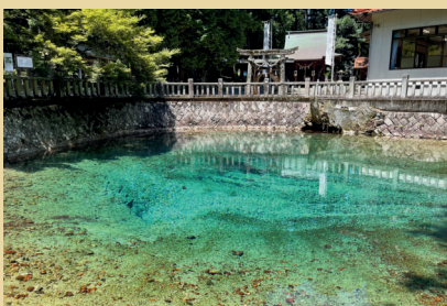
ベップベンテンイケ 別府弁天池