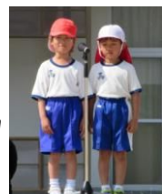
児童代表あいさつ