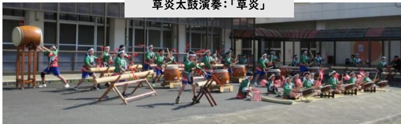
草炎太鼓演奏:「草炎」

保護者の皆様、地域の皆様や卒業生も競技に参加していただき、ありがとうございました。皆様の応援や一緒に運動会を盛り上げてくださるエネルギーが、子ども達の励みになりました。子ども達は、皆様のかっこいい姿にあこがれの気持ちを抱いたと思います。ご協力誠にありがとうございました。