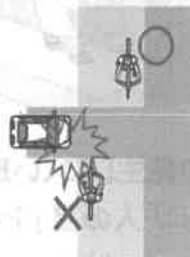
車道寄りで距離を確保