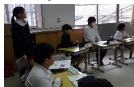
チャレンジ目標のふり返り