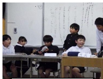
代表委員会の様子