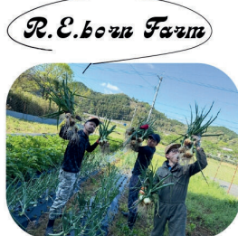
玉ねぎ収穫の様子