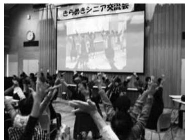
▲秋芳中の生徒と一緒にどっこいしょ!

よい世さ来い体操は、転倒予防や衣服の着脱など生活動作がしやすくなるように、美祢市立美東病院の理学療法士、田代台病院の作業療法士、美祢東地域包括支援センターで考案したオリジナルの体操です。「よさこいソーラン節」のスローテンポに合わせて、椅子に座って行います。みんなで「どっこいしょ!」とかけ声を合わせると元気が出ますよ。グループや団体で興味のある方は、お気軽にお問い合わせください。