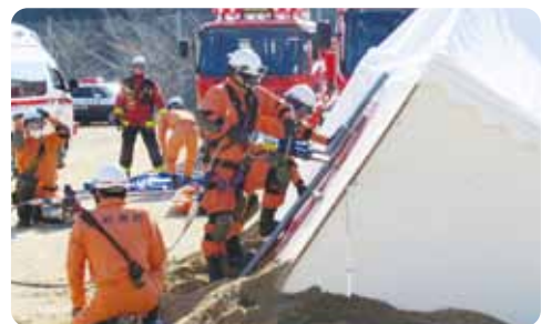
▲油圧カッターを使用した救助訓練