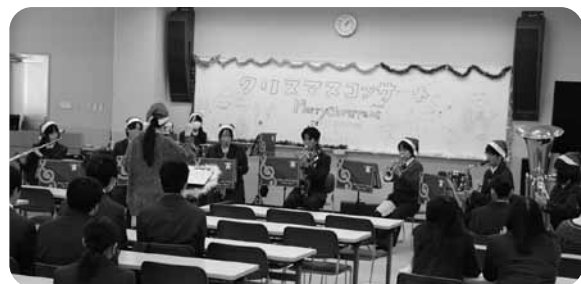
▲コンサートの様子