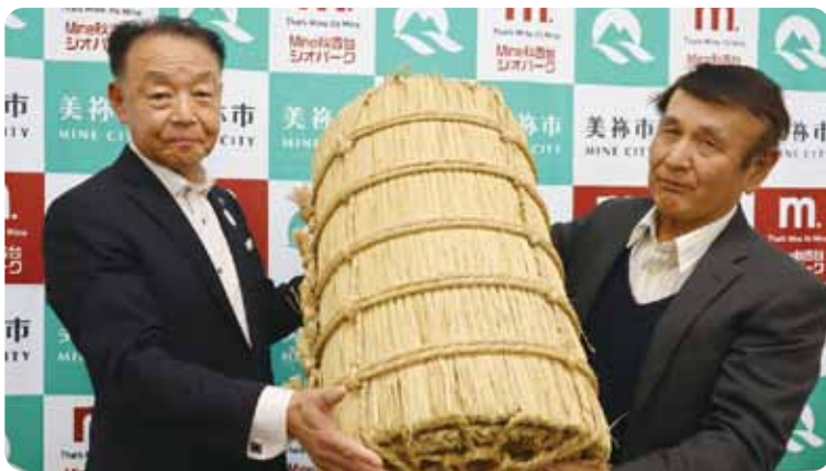
▲左から篠田市長、篠田さん