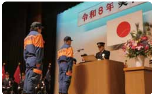
▲消防団親和会長から感謝状授与