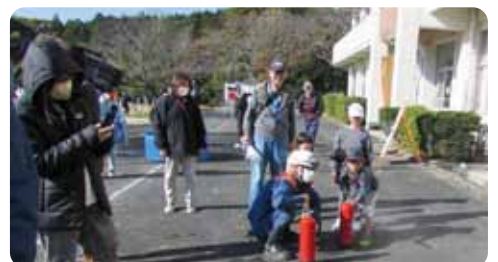
▲水消火器を使った消火訓練