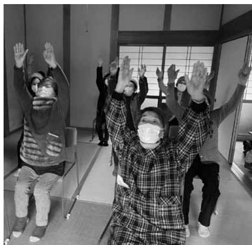
▲野菊サロンの皆さんで

よい世さ来い体操は、転倒予防や衣服の着脱など生活動作がしやすくなるように、美祢市立美東病院の理学療法士、田代台病院の作業療法士、美祢東地域包括支援センターで考案したオリジナルの体操です。「よさこいソーラン節」のスローテンポに合わせて、椅子に座って行います。みんなで「どっこいしょ!」とかけ声を合わせると元気が出ますよ。グループや団体で興味のある方は、お気軽にお問い合わせください。