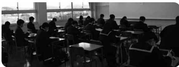
▲緊張感いっぱいの試験会場