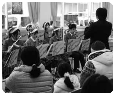
▲大盛況！クリスマスコンサート

12月13日(日)、近隣の幼稚園児と保護者の方々18名をお招きし、世代交流を目的とした「クリスマスコンサート」を開催しました。当日は、サンタさんのみちびきによる「不思議なスライム作り」に挑戦。子供たちが夢中で取り組む姿に、会場は温かな活気に包まれました。続く吹奏楽部による演奏では、おなじみのクリスマスソングが披露され、参加した皆さんはリズムに乗ったり口ずさんだり、世代を超えて楽しいひとときを過ごしました。