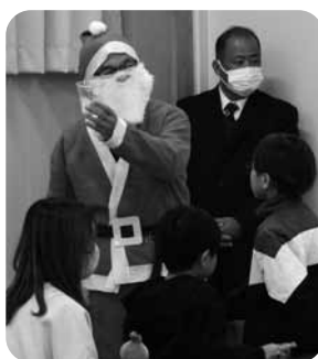
▲サンタさんによる スライム作り？