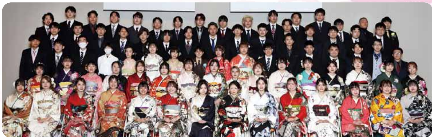
▲大嶺・豊田前地域