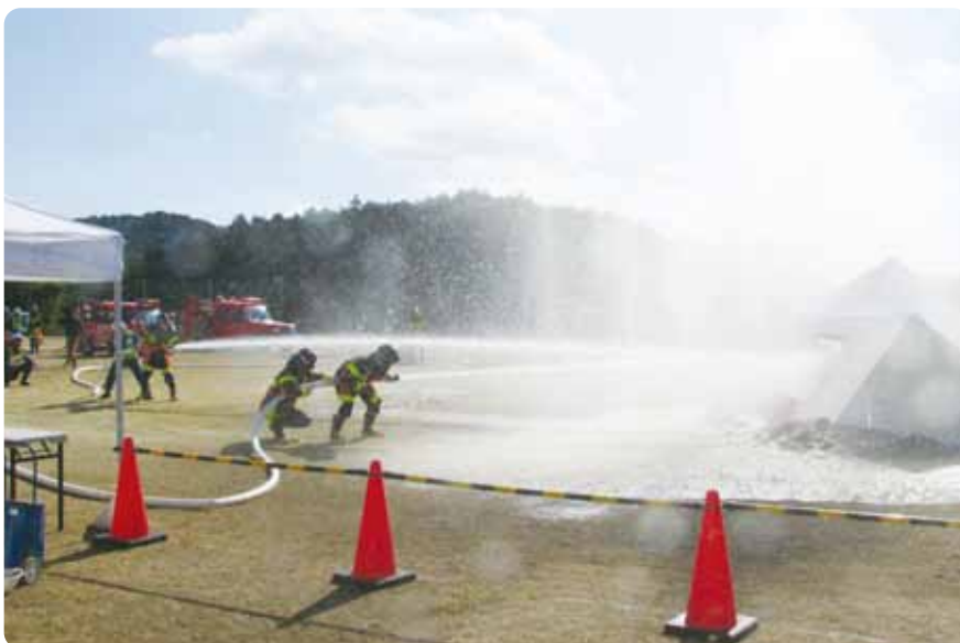
▲消防団による放水訓練

市では災害に強いまちづくりを推進するため、毎年度会場を変えて地域住民と防災関係機関が協働した防災訓練を実施しています。秋吉小学校屋外運動場、屋内運動場を会場として実施した今年度の訓練は、地域や関係機関から約200人が参加し、避難訓練や初期消火訓練、救出訓練など、地震発生に伴う建物倒壊や土砂崩れ、車両事故、火災発生等の複合災害を想定した訓練のほか、関係機関による各種展示体験ブースも設けられ、子どもから大人まで防災活動を体験した一日となりました。