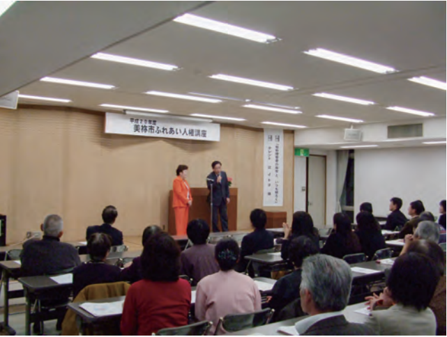
■ふれあい人権講座(H20)