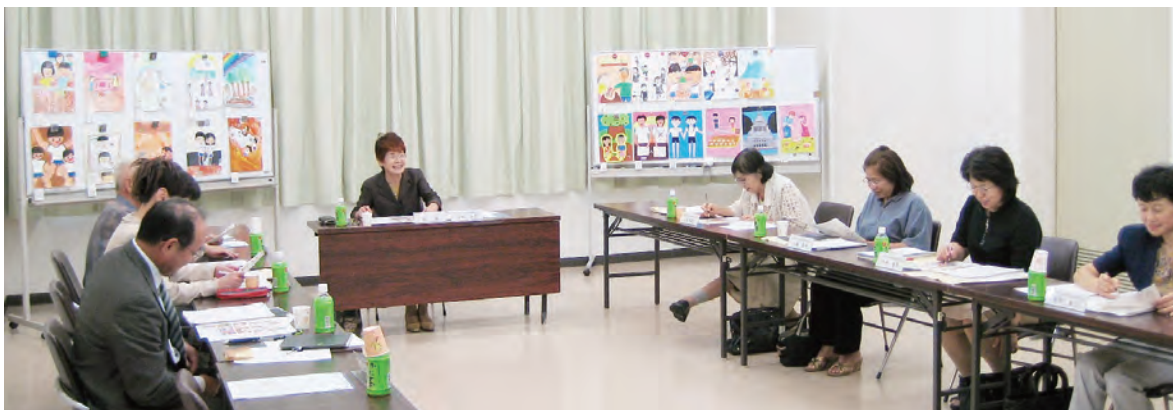
■男女共同参画審議会