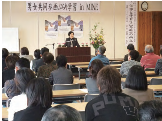
■男女共同参画ぶらり学習 in MINE(H21)