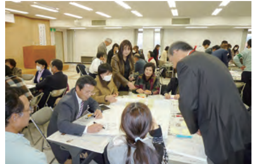
■人権教育リーダー講座(H21)

今後も、人権尊重の理念のもと、現存する様々な人権問題に対応するため、多様な学習機会の充実・啓発活動を展開していく必要があります。