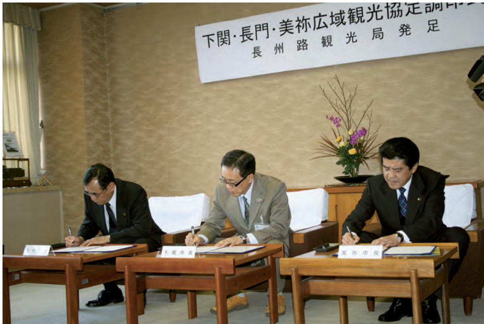
■下関・長門・美祢広域観光協定調印式