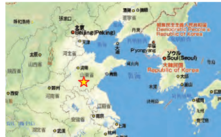
人口 350 万人 総面積 4,550 km 2