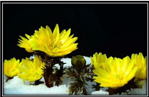
題名「福寿草」