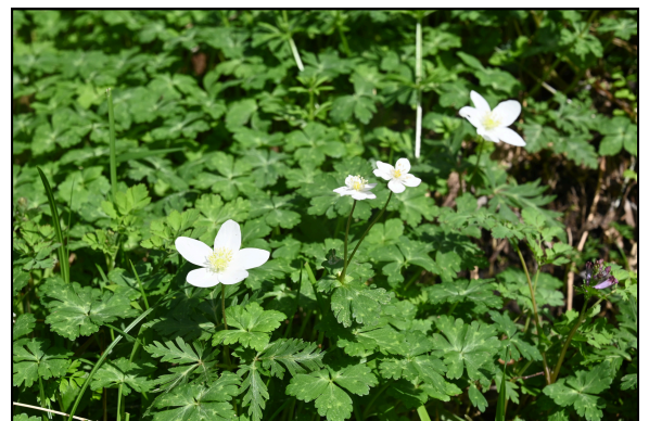
題名「二輪草」