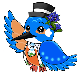
【秋吉公民館マスコットキャラクター】 しゅうきち（秋吉）くん