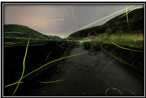
題名「蛭恋川（青景川）」