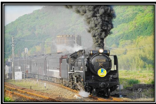
題名「おかえりなさい」