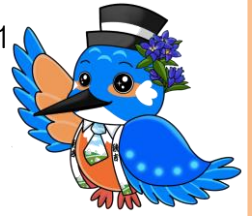
【秋吉公民館マスコットキャラクター】 しゅうきち（秋吉）くん