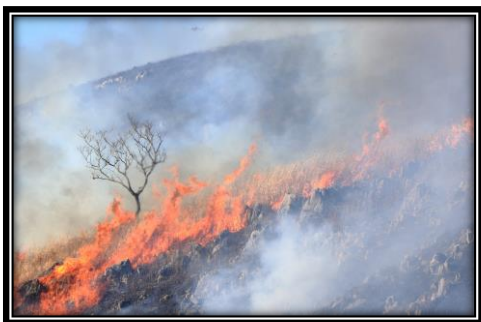
題名「燃え上がる」