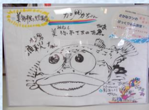
さかなクン 直筆イラスト