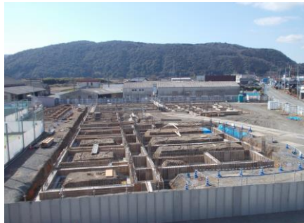
【令和6年3月13日（水）現在の様子】

骨組みとなる鉄筋がセメントで埋め固められ、どこに建物が建つか、少しずつ分かってきました。