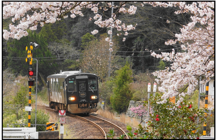
題名「美祢線100」