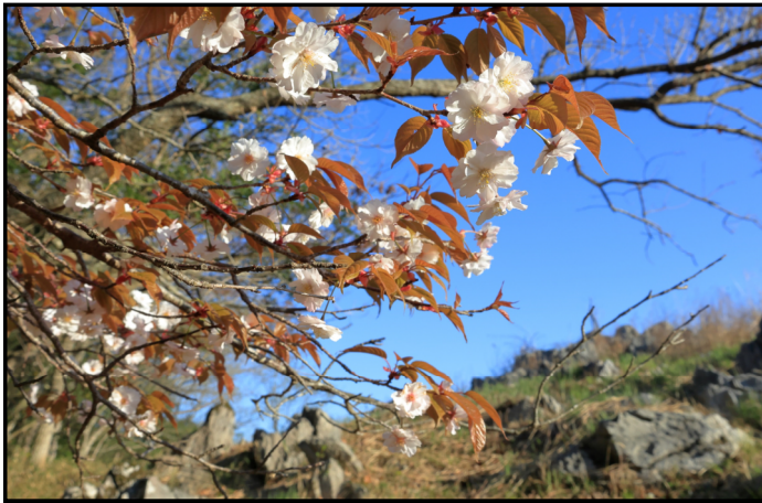
題名「台上の桜」【撮影者 S.T】