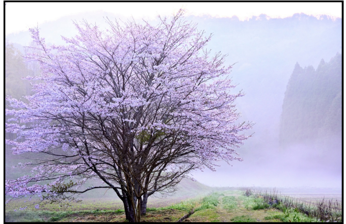
題名「霧に佇む」