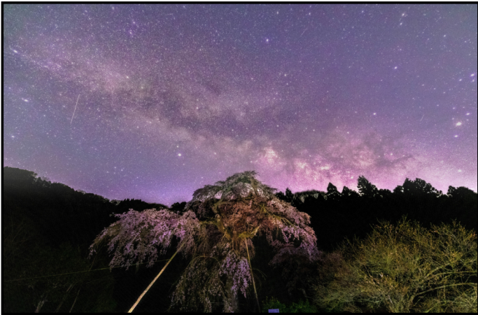
題名「春の競演」【撮影者 H.O】