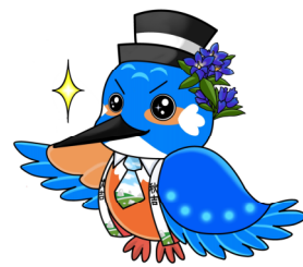
【秋吉公民館マスコットキャラクター】 しゅうきち(秋吉)くん

令和5年度秋吉公民館サークル活動団体を下記のとおり紹介します。 サークル活動に興味のある方は公民館にお問い合わせ下さい。また、 新たにサークル活動を行いたい方も公民館までお問い合わせ下さい。