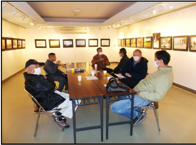
【写真談義に花が咲く】