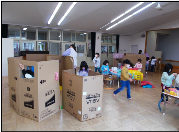
【おうち作りの様子】

12月15日(木)に行われた「にこにこタイム」の様子を撮影に行きました。3～5歳の園児たちが2組に分かれ、「おうち作り」を行いました。