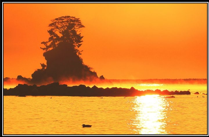
題名「夜明けの雨晴海岸」