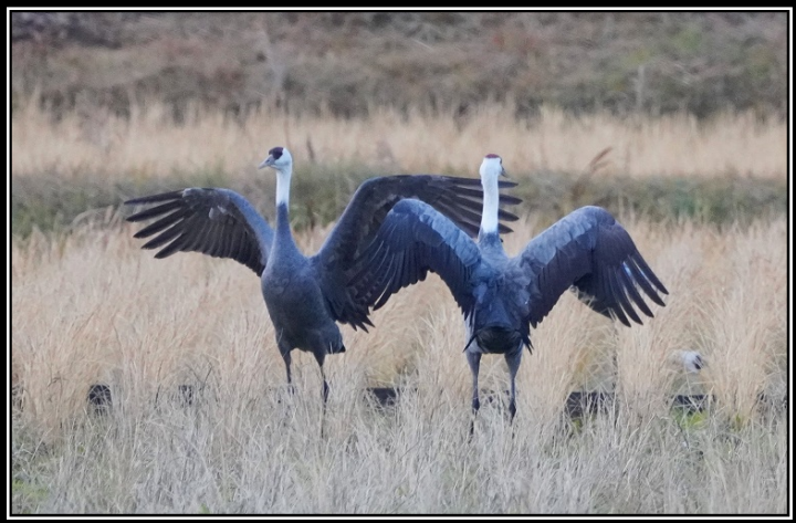
題名「ハッのダス」