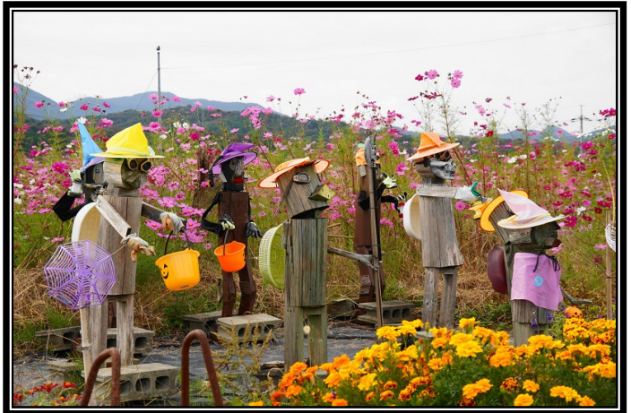
題名「ハワイーンのかかし」