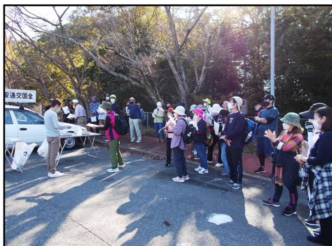
【完歩証を受け取る参加者】