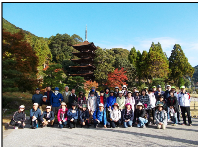
【瑠璃光寺五重塔で集合写真】