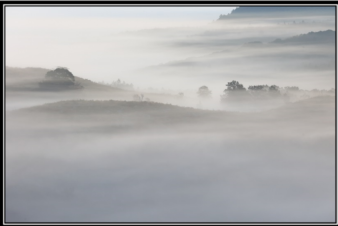
題名「雑木林に漂う」