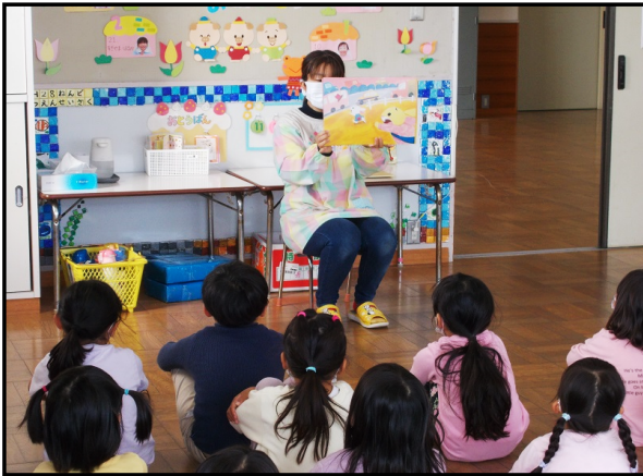
【紙芝居を聴く園児たち】

11月15日(火)に行われた「交通安全指導」の様子を撮影に行きました。 すみれ組、さくら組、ばら組、たんぽぽ組の園児たちを対象に「道路への飛び出しは危ない」ということを先生から教えてもらいました。 最初に先生から交通安全の「紙芝居」を園児たちが聴き、先生から紙芝居の中にあつた危ない行動について質問があり、園児たちは正しく答えており、内容を良く理解していました。 最後に横断歩道を渡る練習をみんなでを行い、交通安全指導は終わりました。 先生から教わつた事を思い出して、道路や横断歩道を渡る際は車に気をつけて、渡つて下さいね。