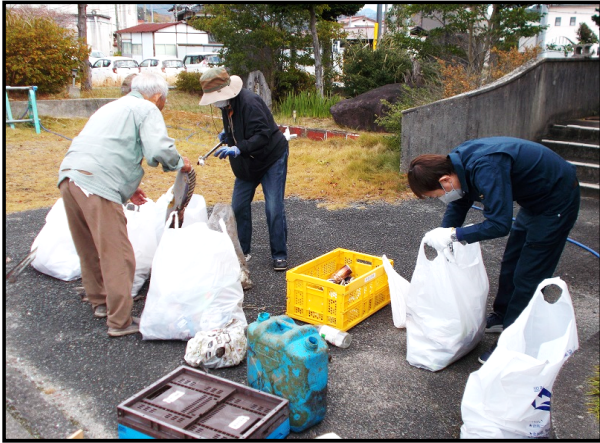
【集めたゴミを仕分けする様子】

11月19日(土)、秋吉公民館で「秋季市民総社会参加活動(清掃活動)」を行いました。