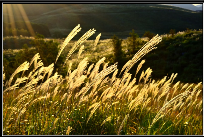
題名「白夜のすすき」