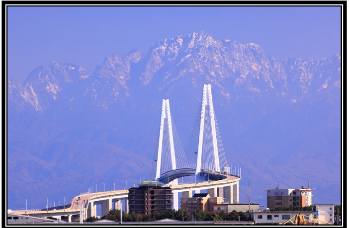
題名「新湊から立山連峰」