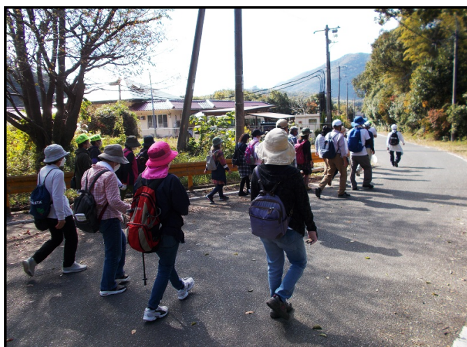
【鳴滝公園を出発する参加者】