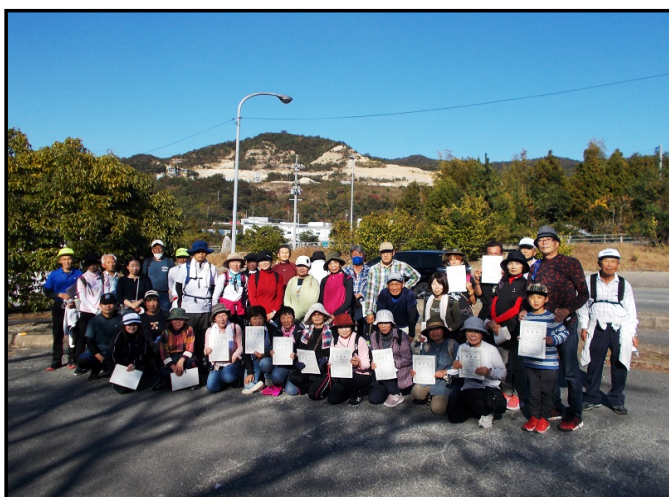
【完歩証を持って集合写真】

11月3日(木・祝)、令和4年度秋芳町歩け歩け大会を開催しました。 今回は「歴史の道百選 萩往還」全長約53kmを令和2年度から令和5年度の4ヶ年で歩く 計画の第3回目として昨年のゴール地点「瑠璃光寺五重塔」から山口市と防府市の市境にあ る「鯖山(佐波山)峠入口駐車場」までの約16kmのコースを歩きました。 絶好の秋晴れの下、参加者はスタッフとして参加した美祿市スポーツ推進委員にコースを 安全に誘導してもらいながら、無事に参加者全員が完歩することが出来ました。 来年度は「歴史の道百選 萩往還」ゴール地点、防府市の「英霊荘(三田尻御茶屋)」ま で行き、「道の駅潮彩市場防府」まで歩くコースを計画しておりますので、秋吉地区の皆さんも是非、ご参加いただければと思います。