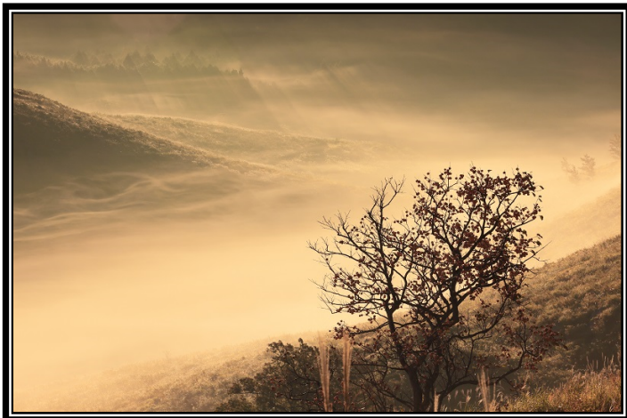
題名「秋の朝霧」