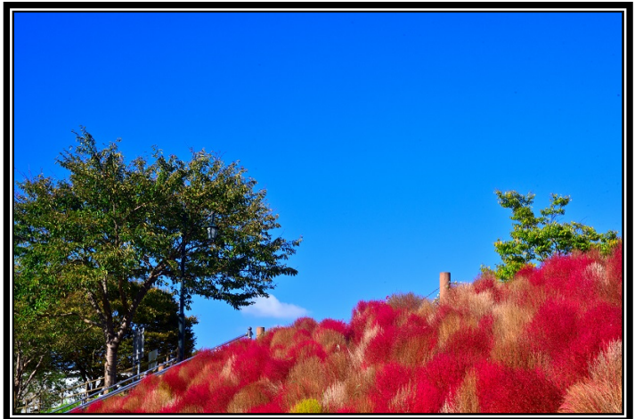
題名「コキア」