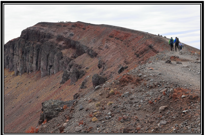
題名「登山道」