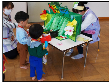
【わにわにぱにっく】