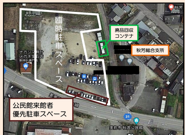
【臨時駐車スペース位置図】