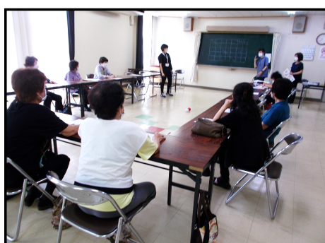
【運動講座「ボッチャ」の様子①】