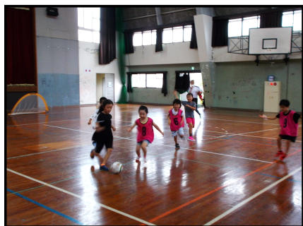
【ボールを使った運動の様子②】

夏休み期間中の7月27日(水)、8月3日(水)、8月17日(水)の計3回、小学生を対象に秋吉公民館と秋芳体育館で秋吉放課後子ども教室を開催しました。