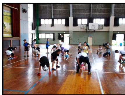
【ボールを使った運動の様子①】