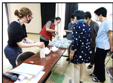
【紅茶とお菓子の試食】