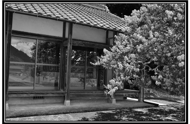
題名「観音堂のサルスベリ」