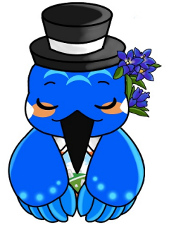
【秋吉公民館マスコットキャラクター】 しゅうきち(秋吉)くん

また、秋芳テニス場も9月30日(金)までの使用となり、当面の期間、使用休止となります。皆様には大変ご迷惑をお掛けしますが、近隣の学校施設(屋内運動場)や秋芳北部総合運動公園テニス場等をご利用頂きますようよろしくお願い致します。