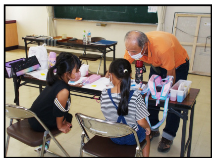
【水彩画教室の様子②】