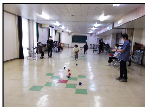
【運動講座「ボッチャ」の様子②】

8月26日(金)、9月9日(金)に第2回・3回婦人学級が秋吉公民館で行われました。