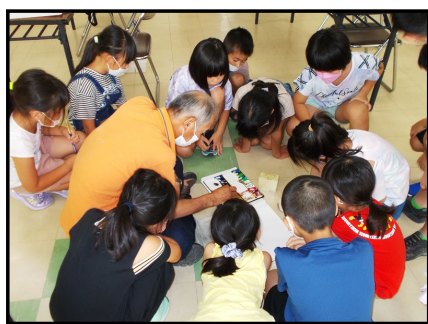
【水彩画教室の様子①】