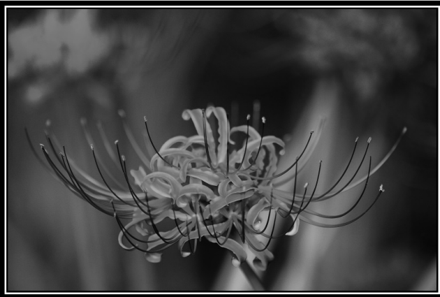
題名「彼岸花」