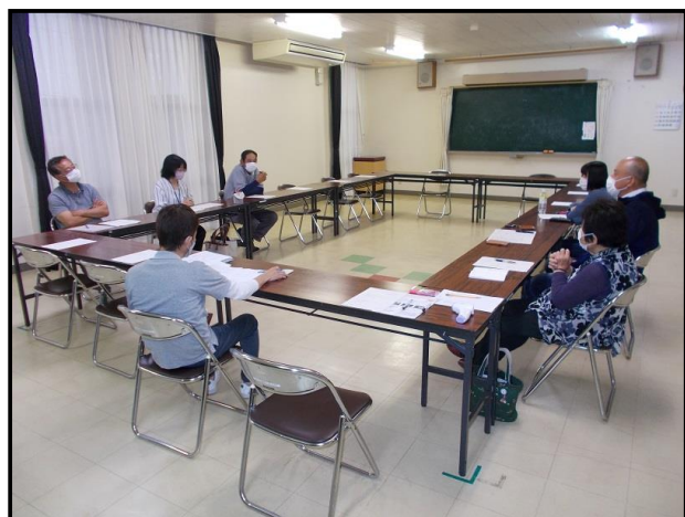
【実行委員会の様子】

6月14日(火)、秋吉公民館で「第1回秋吉地区納涼ふるさと夏祭り実行委員会」が開催されました。新型コロナウイルス感染症拡大防止の為、2年連続中止となりましたが、今年は秋芳体育館の解体もあり、小規模でも良いから開催する事に決定しました。3年ぶりの開催という事もあり、夏祭りの役割を担当していた団体が活動を止めたり、高齢化により、担当出来ない等の団体もあり、夏祭りの行事日程の見直しや新型コロナウイルス感染症対策、「実行委員長」「副実行委員長」の選出を次回の実行委員会で協議する事になりました。実行委員会で安全で楽しい夏祭りを開催出来るように協議していきますので、秋吉地区の皆さんのご理解・ご協力をよろしくお願い致します。