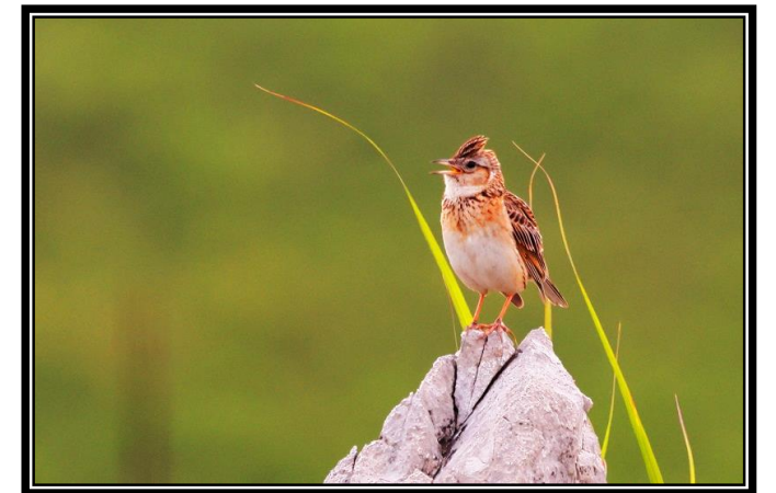
題名「美空に鳴くひばり」