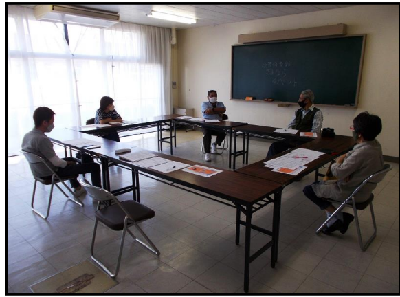
【実行委員会の様子】