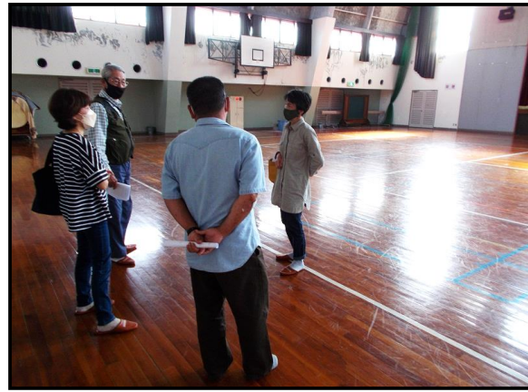
【館内を確認する委員】