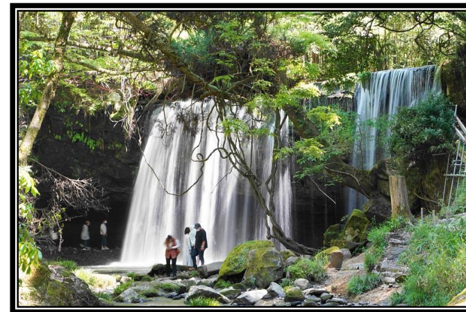
題名「鍋ヶ滝」