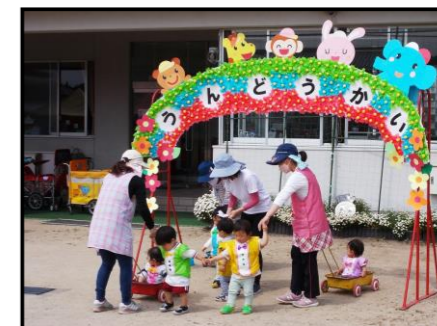
【遊戯「どうぶつれっしゃがやってきた」】