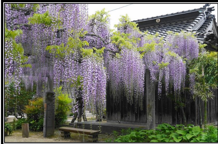
題名「明教寺の大藤棚」