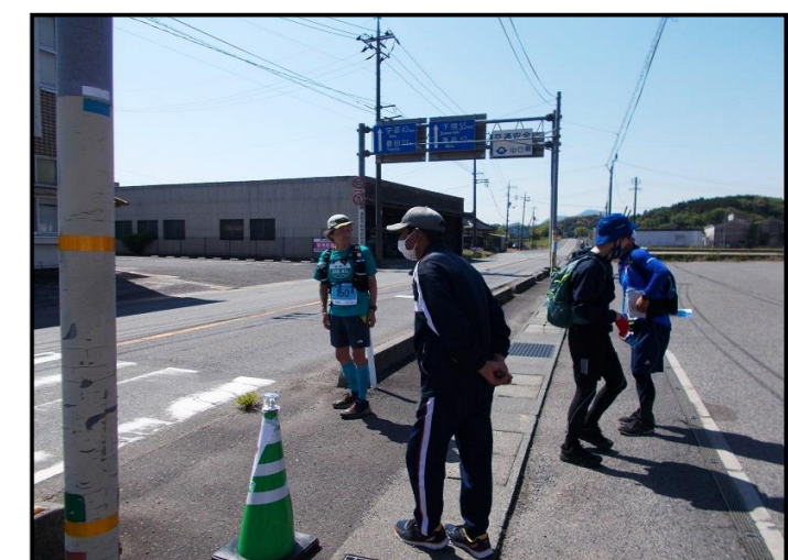
【ピックアップ(秋吉公民館)に向かうランナー】

5月3日(火)・4日(水)の2日間、第4回赤間関街道中道筋マラニック大会(主催：赤間関街道中道筋マラニック大会実行委員会)が開催されました。第2回・3回大会は中止だったため、3年ぶりの開催となりました。