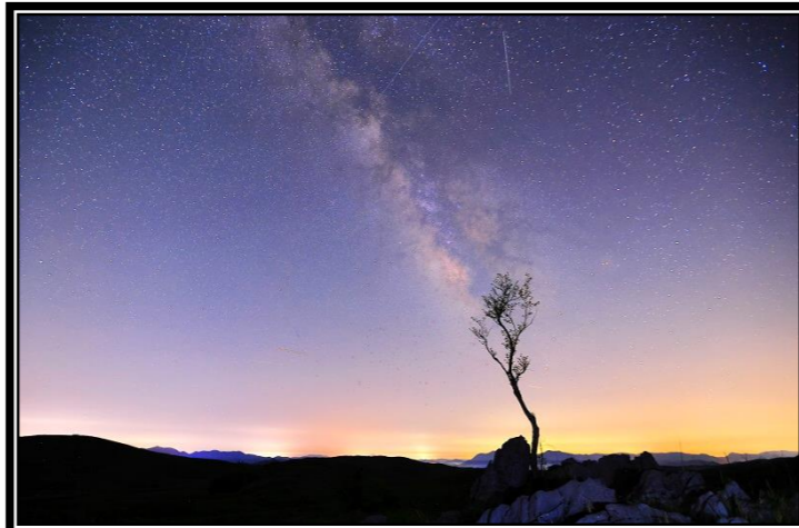
題名「人工衛星?と天の川」