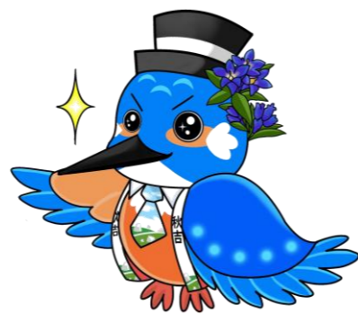
【秋吉公民館マスコットキャラクター】しゅうきち(秋吉)くん

現在、5月27日(金)まで「秋芳体育館解体イベント実行委員大募集!!!」という事で、チラシの全戸配付、美祢市ホームページや美祢市防災行政アプリ等で実行委員を募集しています。予算はありませんが、出来る範囲で秋芳体育館を利用したイベントを計画したいと考えていますので、秋吉地区の皆さんのご協力をよろしくお願い致します。