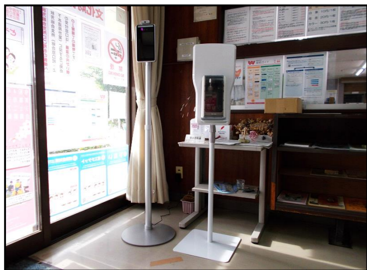
【左が検温器、右が手指消毒器】

秋吉公民館玄関ロビーに非接触式検温器と自動手指消毒器を設置しました。公民館ご利用の際は、検温と手指消毒を行っていただき、施設をご利用下さい。