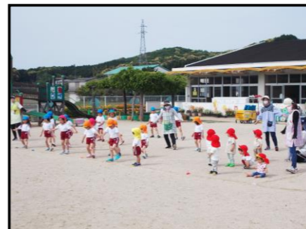
【体操「ペンギン体操」】