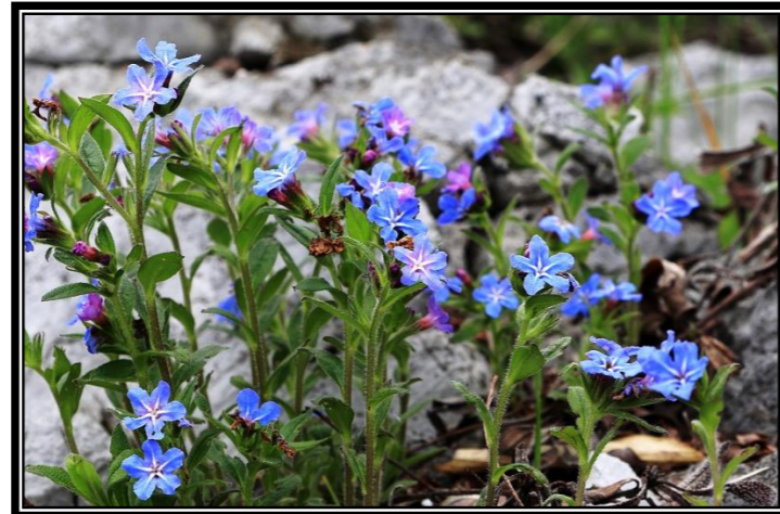
題名「ホタルカズラ」