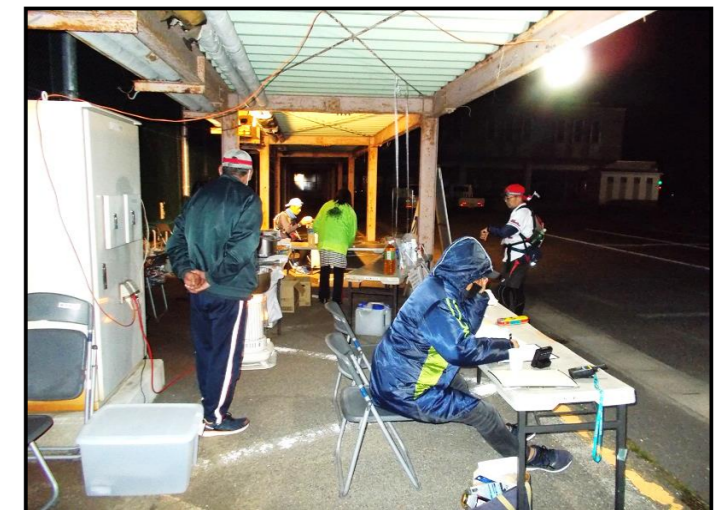
【124kmコース(復路)の様子②】