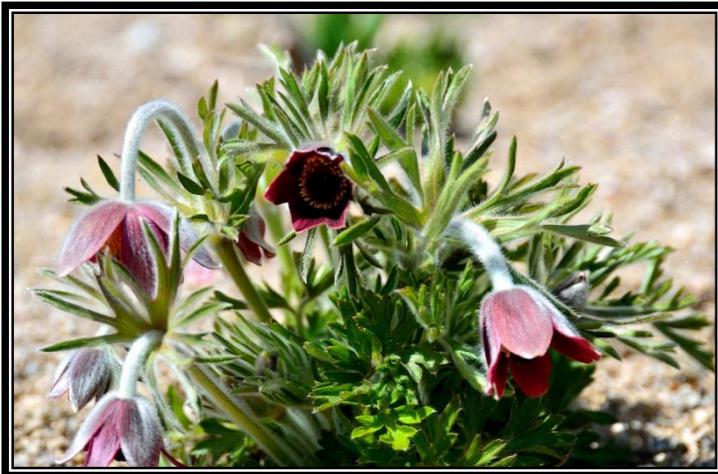
題名「オキナグサ」