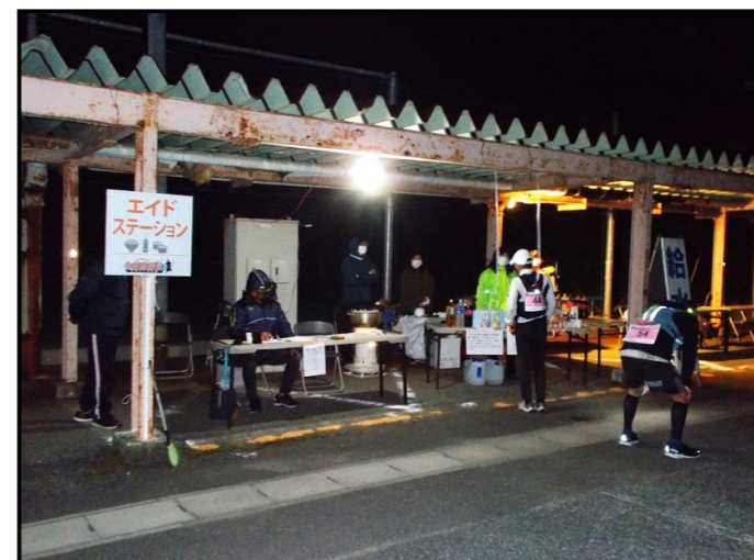
【124kmコース(復路)の様子①】