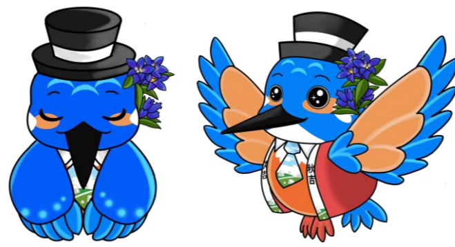
【秋吉公民館マスコットキャラクター】しゅうきち(秋吉)くん

秋吉公民館玄関ロビーに非接触式検温器と自動手指消毒器を設置しました。公民館ご利用の際は、検温と手指消毒を行っていただき、施設をご利用下さい。