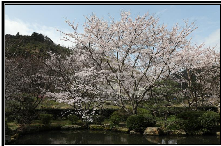
題名「橋本川沿い」