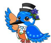
【秋吉公民館マスコットキャラクター】 しゅうきち（秋吉）くん