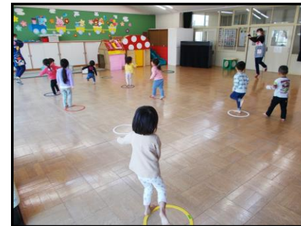
【運動会の練習の様子】