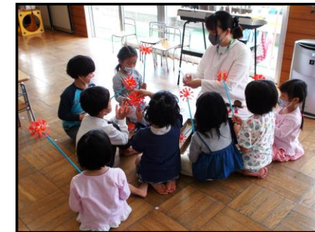
【こいのぼり作りの様子】