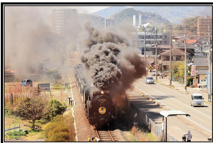
題名「ザビエルとSL」