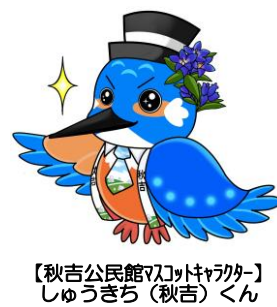
【秋吉公民館のキャラクター】 しゅうきち（秋吉）くん

令和4年度秋吉公民館サークル活動団体を下記のとおり紹介します。 サークル活動に興味のある方は公民館にお問い合わせ下さい。また、 新たにサークル活動を行いたい方も公民館までお問い合わせ下さい。