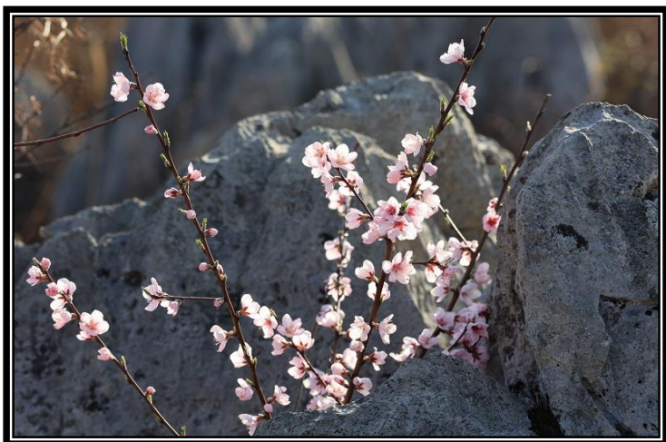
題名「岩間の桃」