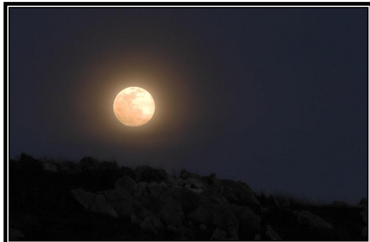
題名「ピンクムーン」