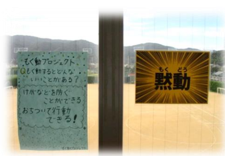
おおみねしんしん