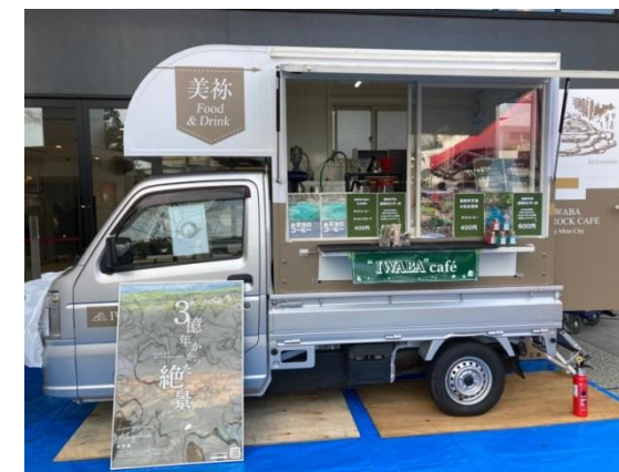
キッチンカー「IWABA ROCK CAFE」

そのほかにも、キッチンカー「IWABA ROCK CAFE」で市内外のイベントへ出向き、地域のPRをされるなど、その業務は幅広いものとなっています。