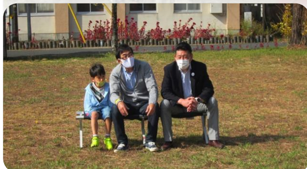
【中本教育長もいらっしゃいました！】