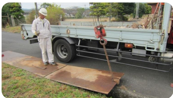
【小田土建さんが溝に鉄板を設置してくださいました！】

公民館行事として初めての試みで不安もありましたが、これからもコロナ禍でもできること、コロナ禍だからこそできることを常に考え、共和地域を盛り上げるイベントを企画していきますので、地域の皆様のご協力とご参加をお願いします！