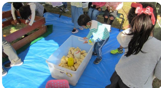
【ひよこかわかったかな？】