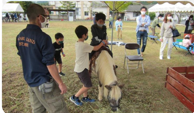
【ポニーの乗り心地はどうだったかな？】