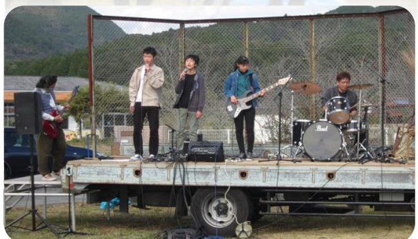
【地元の高校生もバンド演奏で盛り上げてくれました♪】