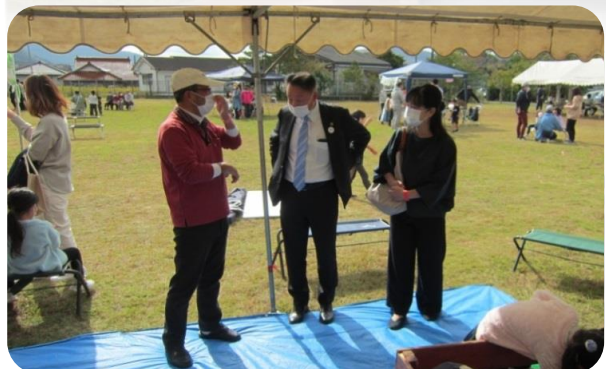
【篠田市長もいらっしゃいました！】