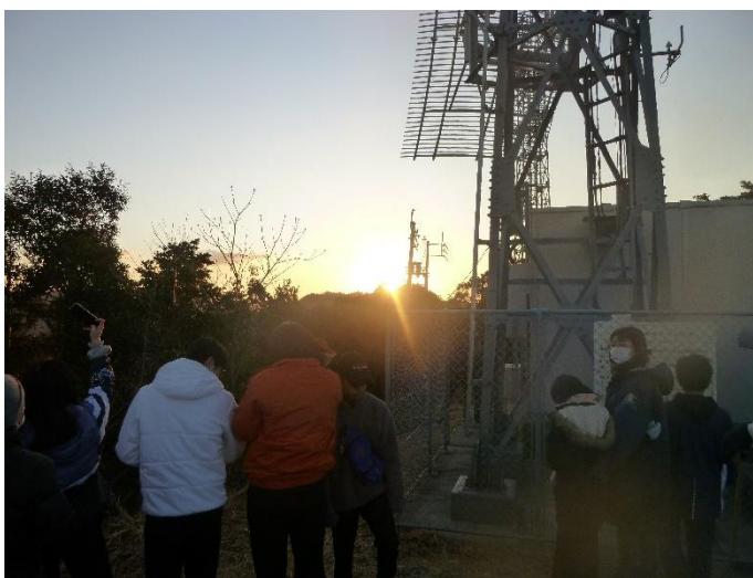
【頂上からの初日の出のようす】

新型コロナウイルス感染症の影響により、子ども会が例年行っていた雑煮の提供は中止としましたが、代わりに参加者全員に温かいおしる粉缶と中学生以下にお菓子の詰め合わせが配られました。