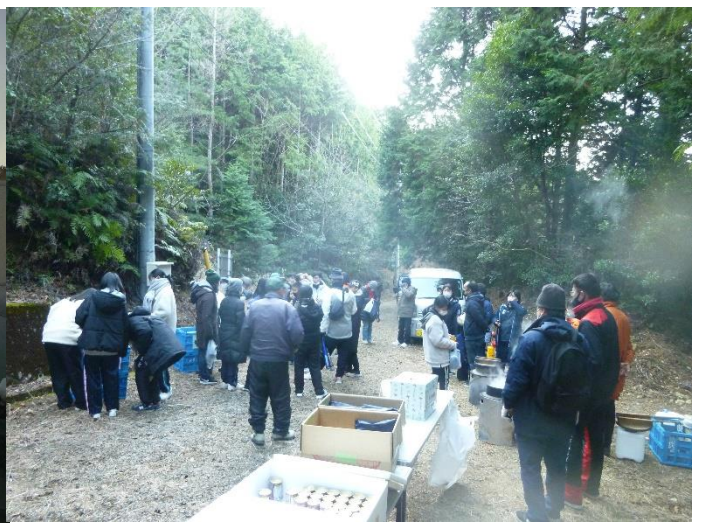
【景品選びのようす】