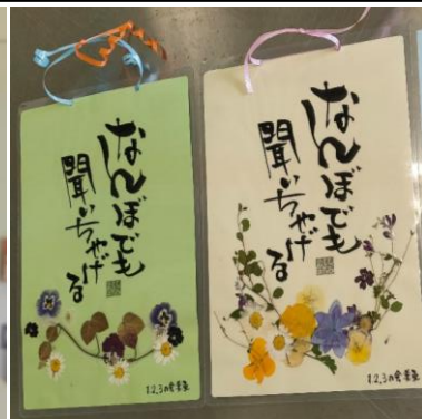
完成した誕生日カードは、花の種類や配置によって、1枚1枚が違う作品に仕上がります。