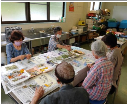
押し花を紙の上に置き、カードをデザインします。 会話にも花が咲き、楽しく作業をされていました。

綾木公民館では複数のサークルが定期的に活動を行っています。 なお、新規加入を受け付けているサークルや、見学が可能なサークルもありますので、関心がある方は公民館にご連絡ください。