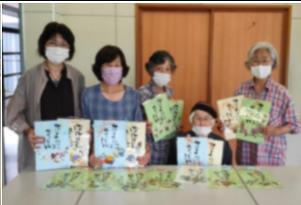
誕生日カードはラミネート加工をして完成です。 昨年度は、234枚のカードを作られたそうです。