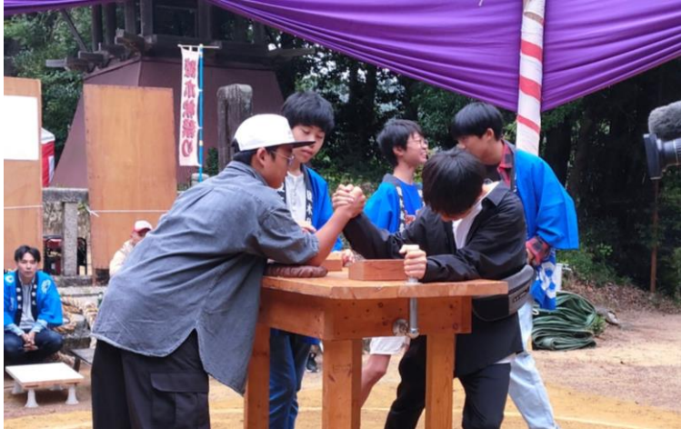
中学生企画のイベント