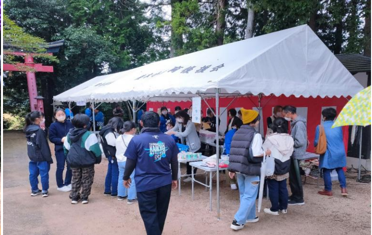
お祭り会場の様子

10月8日（日）、綾木八幡宮において「第26回綾木秋祭り」が4年振りに開催されました。