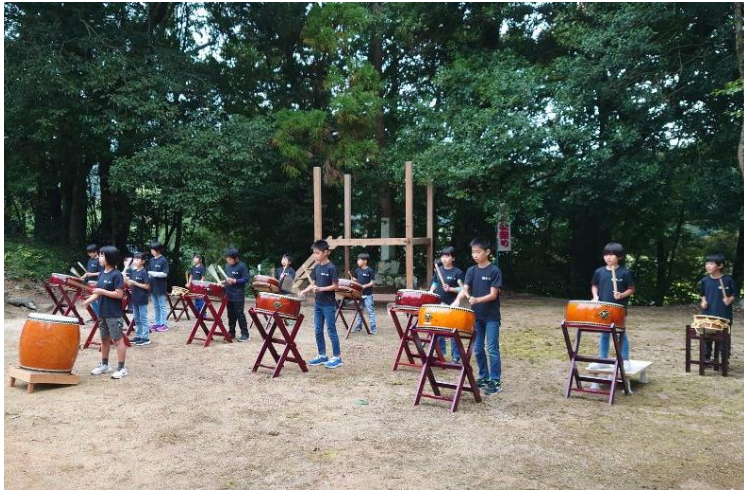
綾木小学校児童による太鼓の披露 「太鼓教室（放課後子ども教室）」で夏休み明けから毎週練習し、その成果を発揮することができました