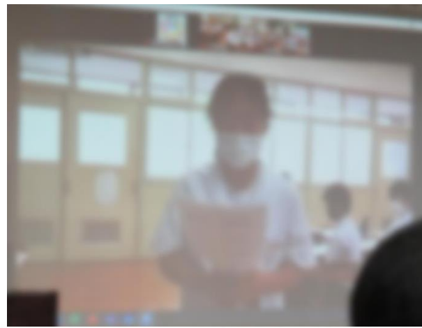
リモートでの発表の様子