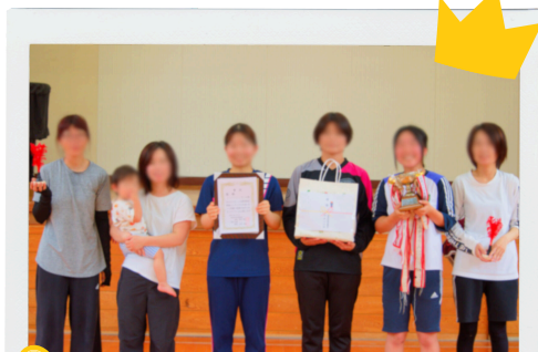
1 長尾・平沼田・駒ヶ坪 チーム

となりました!! また、今大会は多くの方のご協力によりけがなく無事終わることができました。みなさんありがとうございました!