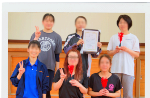
3 本郷・土器 チーム