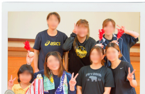
2 大村 チーム