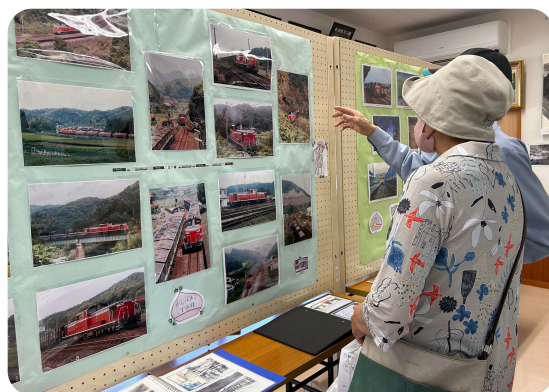
↑ 下関から来られたお客さん

市内外から展示作や美祢線の歴史に興味を持った多くの方が来場され、懐かしい美祢線の写真を見ながら思い出トークを交わしていました。