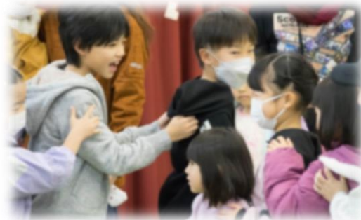
なが〜いジャンケン列車