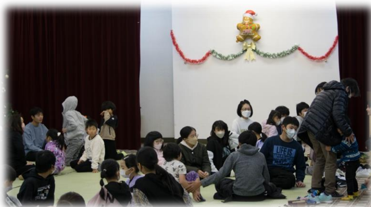
サンタのプレゼントは何かな？

令和元年以来、久しぶりに参加者 40 名が一堂に集まることができました。今年も厚保中学校の有志の皆さんにゲームの企画から、会場の装飾・当日の運営までご協力いただきました。生徒の皆さんありがとうございました。関係者の皆さま、大変お世話になりました。