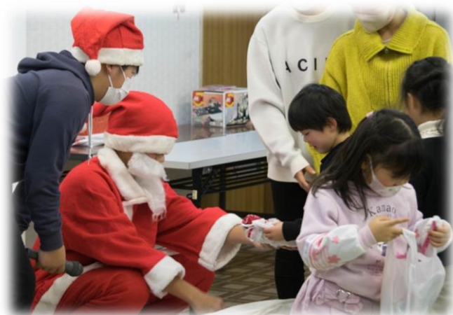
大活躍の中学生！ありがとうございました