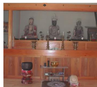
観音堂内部(真ん中が十一面観音)