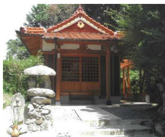
吉友にある観音堂

と逆上した。可愛さ余って憎さは百倍。女の一念物凄く、遂に蛇となり、吉友にある十一面観音に詣で、夜な夜な呪いの釘を打った。お伝の執念は江戸に通じ、平三の眼前に蛇になって現れ、とうとう平三は呪い殺された。お伝もうらみの一念を達して相果てた。今も平国木にはお伝屋敷、平三屋敷の地名が残っている。